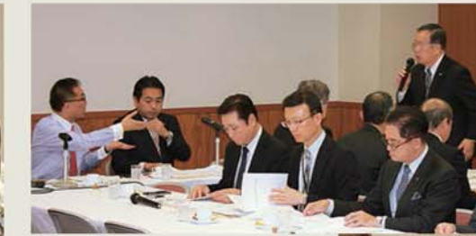
◀ 自民党ヒヤリングで要望 (2018年11月13日)