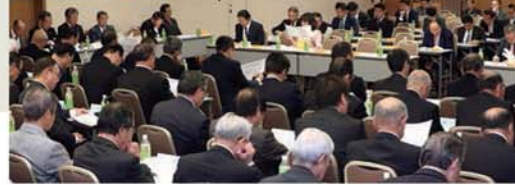
◀ 宮沢洋一自民党税調会長に要望 (2018年11月26日)